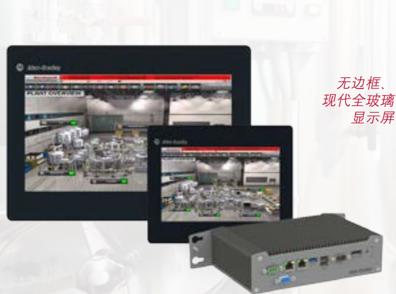
无边框、 现代全玻璃 显示屏

开放式架构支持现代操作系统和各种软件应用程序，但理想部署是将 FactoryTalk®View SE 软件用于分布式应用。该产品线完全无风扇、免维护，可缩短成本高昂的停机时间。