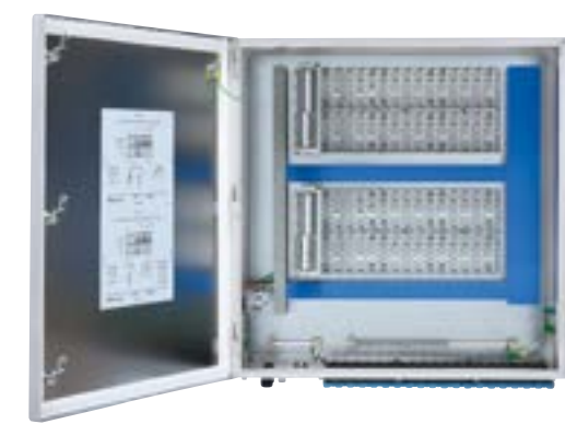
Sistema de E/S 1718 Ex con chasis de 40 ranuras

Sistema de E/S 1718 Ex en envolvente de poliéster con refuerzo de vidrio (GRP) de Pepperl+Fuchs. Para obtener más información sobre los sistemas de E/S 1718 Ex, consulte el perfil 1718-PP001 .