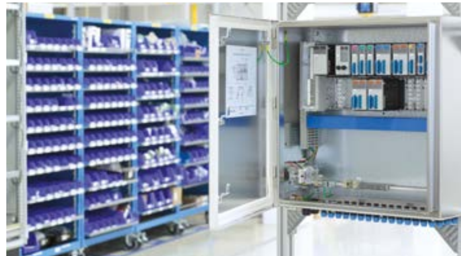
Envolvente de E/S distribuidas apto para entornos clasificados como Zona 1/21

PartnerNetwork son empresas prominentes con experiencia en la entrega de productos o servicios diseñados para funcionar con nuestras soluciones. La colaboración entre los miembros ayuda a optimizar su cadena de suministro, a simplificar la implementación de proyectos y a ofrecer el mejor valor por su inversión en automatización.