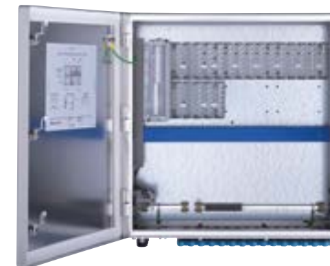
Sistema de E/S 1718 Ex con chasis de 10 ranuras